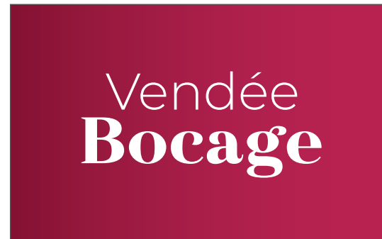
SUR FOND COULEUR UNI