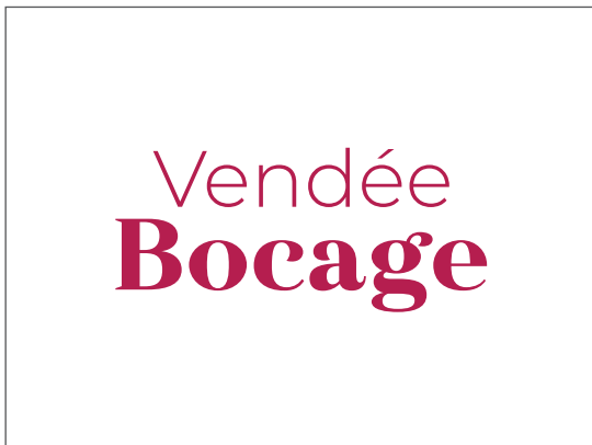
SUR FOND BLANC OU PEU INTENSE

Le logo en version monochrome peut être utilisé sans le cadre en fond blanc.