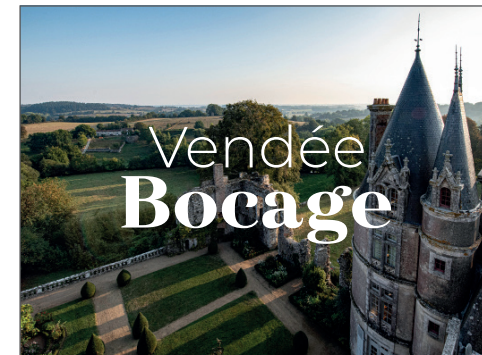
SUR UNE IMAGE DENSE